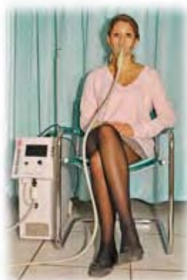
4. Sauerstoff- Mehrschritt-Therapie

Nach der Meridian-Diagnostik werden die Therapieziele mittels Behandlungsplan erstellt. Diese bestehen aus der Laser-Therapie, Akupunktur